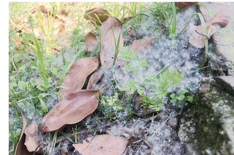
▲湘江风光带的草丛里散落了柳絮

本报(记者 戴凇)如果你家宝宝最近总是干咳、打喷嚏,可别急着服用感冒药,因为很可能是过敏作祟。记者昨日从省直中医院了解到,近来门诊看感冒的儿童中,有近三分之一其实是因为接触到了过敏源。