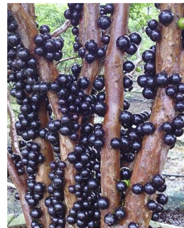
▲嘉宝果直接长在树干上

日前,一种外表看似葡萄却不是葡萄的“天价”嘉宝果刷了屏。它淡季时价格可以卖到每公斤100元,最高时甚至每公斤500元,连树苗价格也是30元到800元不等。嘉宝果究竟是一种什么水果,它来自哪里?日前,成都中医药大学药学院副教授陈江向记者介绍了这种水果。