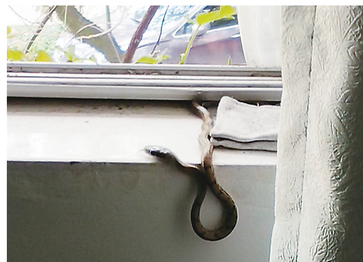
▲蛇从窗口爬了进来

本报讯(记者 戴凛)昨日下午,天元区某单位办公室来了一名不速之客——一条长约50厘米的蛇。