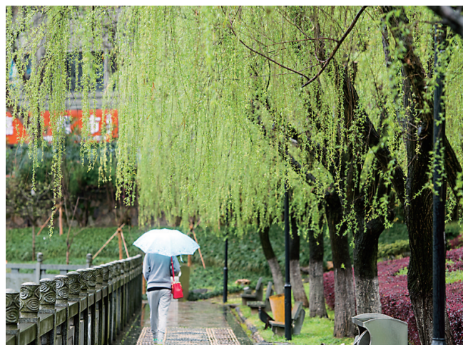
神农公园的柳树下,市民在悠闲散步。