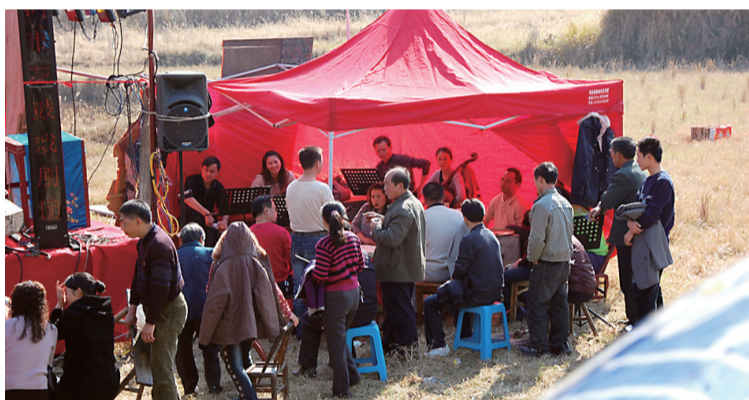
乐队架起临时大棚为舞台表演吹拉弹唱。