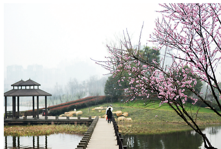
神农湖边,鲜花盛开。