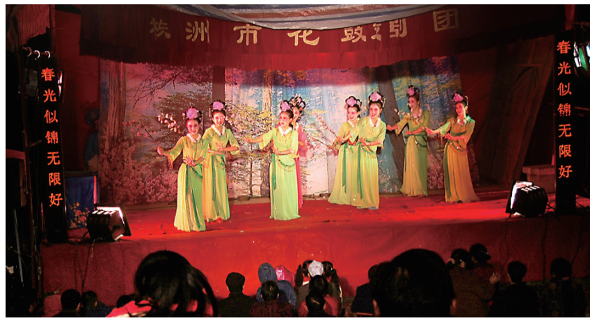
演员们在田垌中临时搭建的舞台上表演。