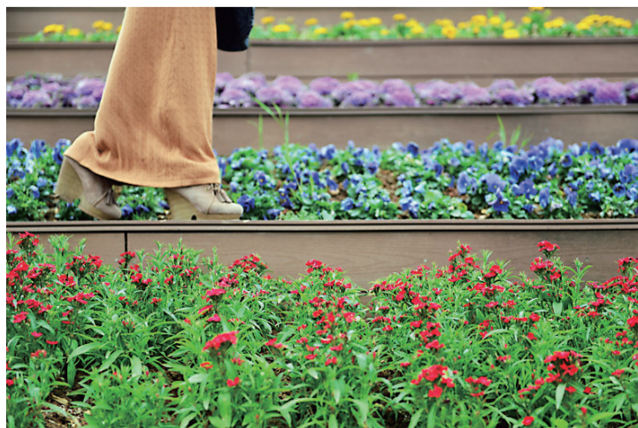
风光带,一位女子穿行在花丛中。