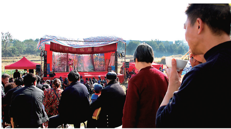
一边吃饭一边看表演。