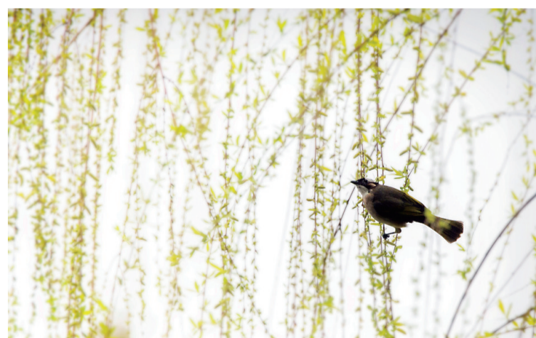
神农城里,鸟儿在刚发芽的柳枝上小憩。