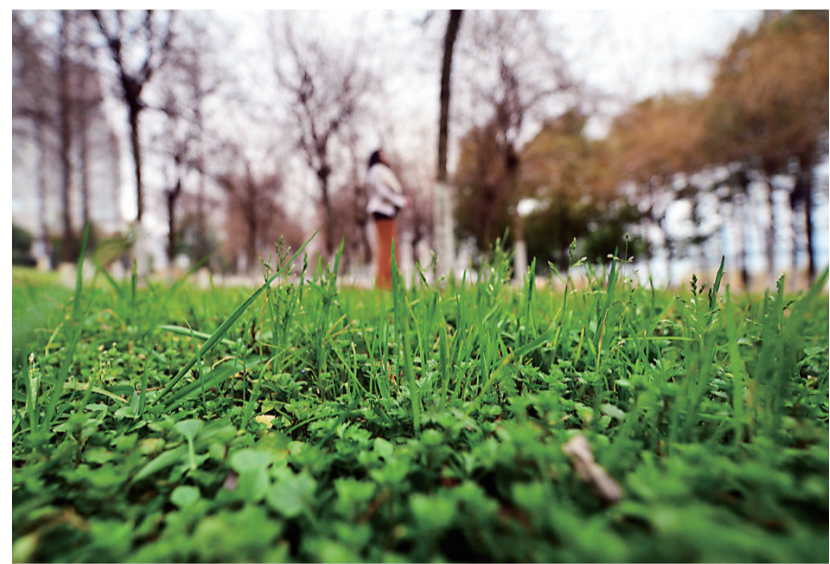
风光带路边,春天到来,万物复苏。