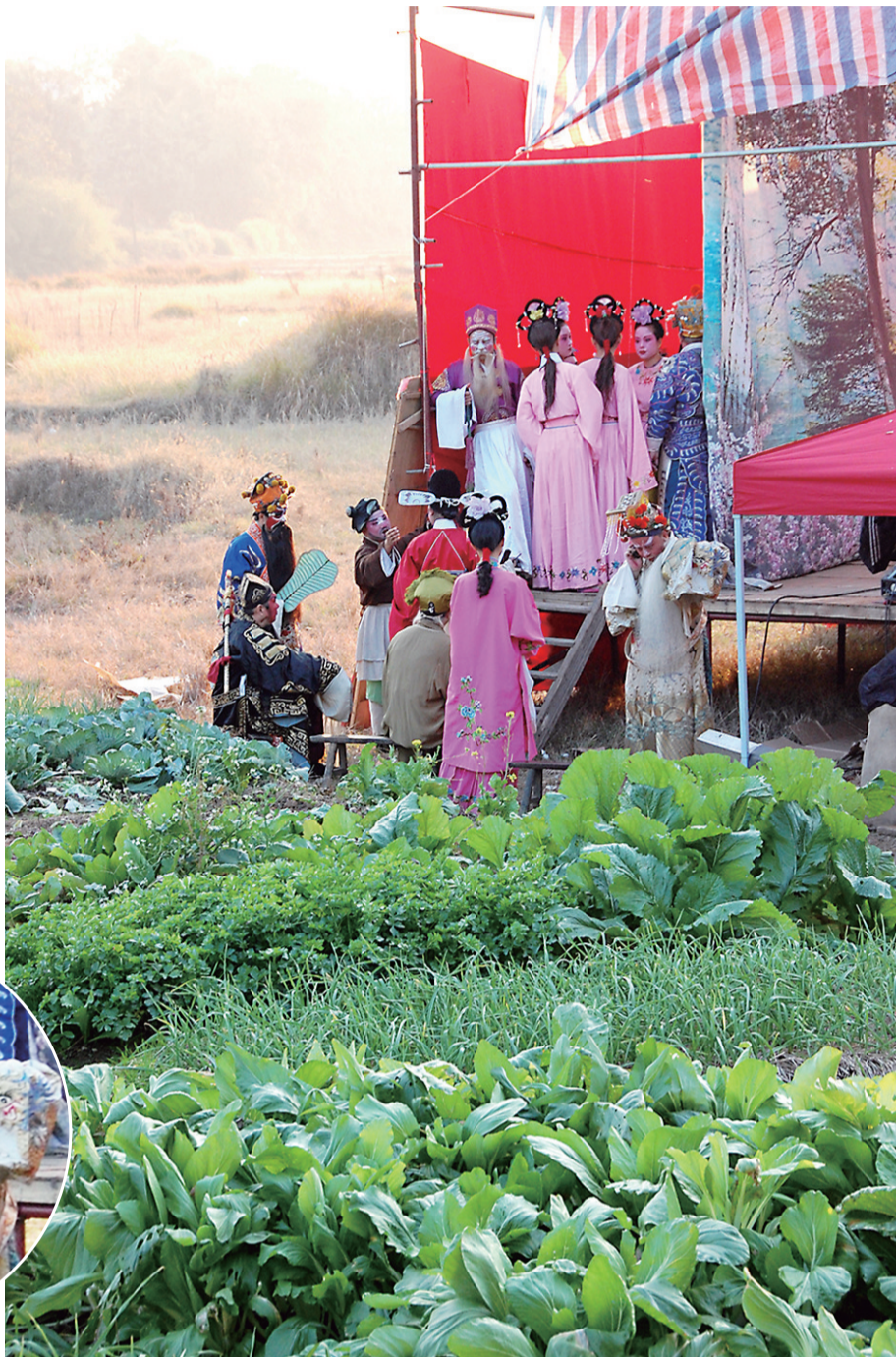
男女演员们穿着戏装站在田垌蔬菜地里候场。