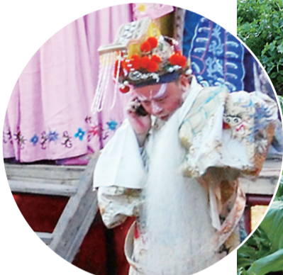
这位“皇上”穿着龙袍站在蔬菜地里打手机。