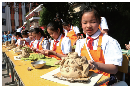
石峰区光明学校的同学们在泥塑课上享受创造的乐趣