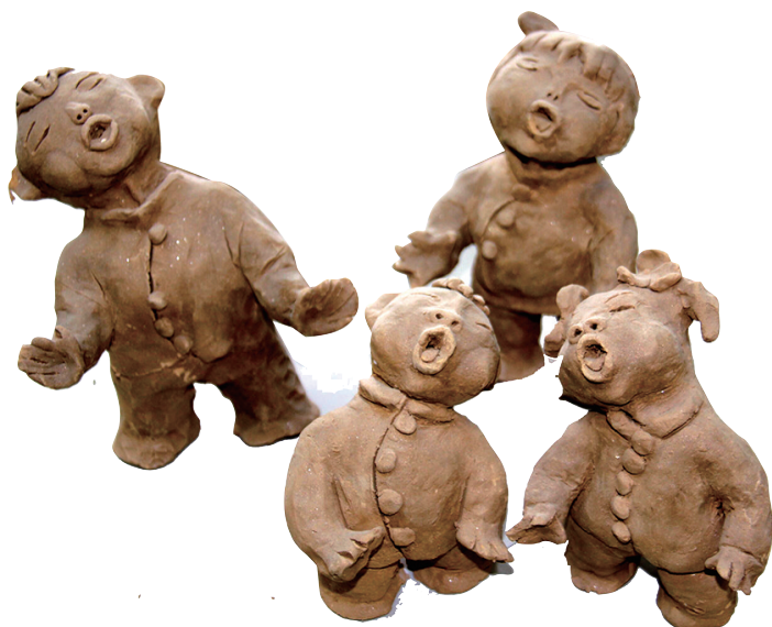
在光明学校的泥塑作品陈列室,一件件造型多样的泥塑作品令人赏心悦目,老师、家长、学生都常常驻足在作品前观赏品评。泥土是常见的,但要把泥土做成泥塑,就需要孩子们用心去雕琢了。