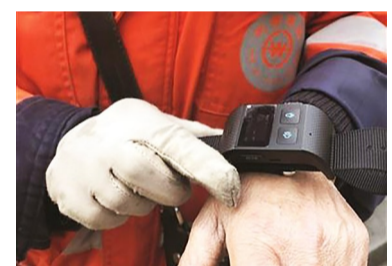
记者了解到,目前该手环的20分钟提醒功能已取消。

最近,南京建邺区的环卫工人人都陆续配发了一款智能手环,这款智能手环除了具备时间、天气等基本功能外还有呼叫对讲、实时定位以及一键呼救等功能。然而也有不少人提出意见,比如实时定位是不是暴露了隐私?而且一旦在原地不动超过20分钟,智能手环还会自动发出语音提醒,给环卫工“鼓劲加油”,这点则让一些人觉得有些“歧视”环卫工。