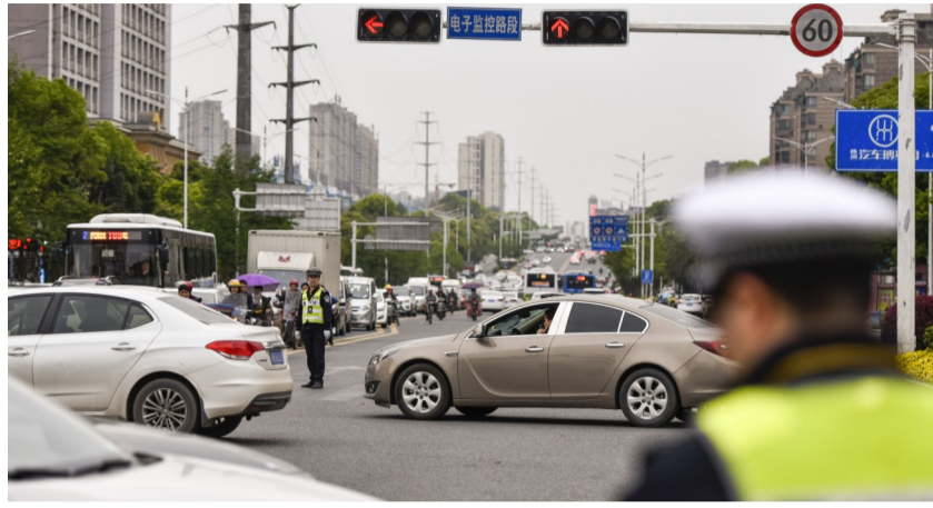
▲由于响石广场施工分流,芦淞大桥西头附近的交通压力激增

本报讯(记者 刘玺 通讯员 彭晚华)石峰区响石广场第二阶段施工启动以来,响石广场附近的交通压力激增,而周边分流道路流量也同样上涨。前日,市公安局交警支队发布绕行提醒。