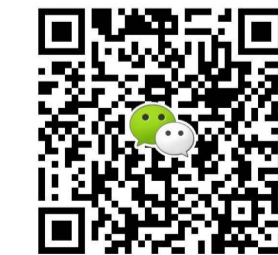
扫一扫上面的二维码,加微信