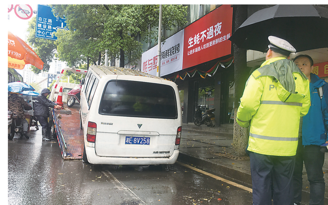
▲这辆“僵尸车”被拖走

本报讯(记者 戴凇)昨日下午,位于芦淞区人民南路的一辆“僵尸车”被交警部门拖走。有数据显示,该车在此已停放256天。