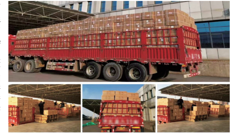
▲各品牌直发株百仓库货源陆续进仓

业内人士透露,每年4月至10月都是家电产品的销售旺季,进入6月后,受供需关系的影响,各品牌的家电产品都有不同程度的上浮,尤其是夏天应季热销的电器产品,如空调、冰箱等,在旺季时价格更为坚挺。“4月是购买电器的好时机,因为此时市场刚进入热销期,但并没有达到高峰期,所以货源充足,型号齐全,顾客有更大的选择余地,并且送货安装的时间也会较高峰期时更快一些。”某空调品牌负责人表示。 除此之外,每年在旺季来临时,厂家为了避免人员、设备的相对闲置,会在这个阶段采取较大的让利销售政策,因此消费者在这时出手,可谓是有利可图。株百家电负责人表示,株百家电正是瞄准了这一