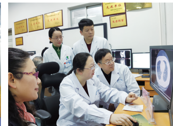
▲放射科医生正在阅片