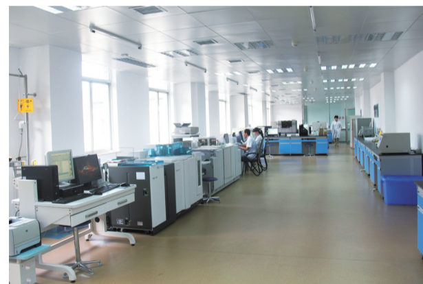
▲株洲市三三一医院检验科

提起检验科,大部分人认为检验科就是一个抽血、验血、验尿的科室。其实不然,尽管他们较少直接面对患者,却是患者病情的“知情者”。