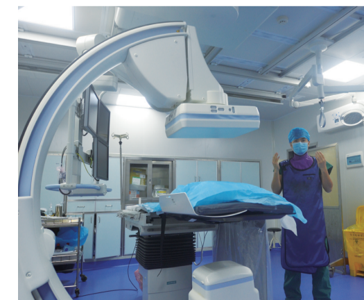
▲株洲市三三一医院放射科