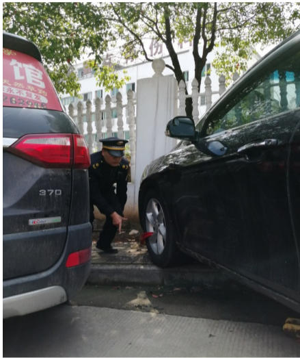
▲城管执法人员对违停车辆进行锁车处理

本报讯(记者 陈驰)前两天,天元区圆方路嘉墅·翰林阁多名业主向市长热线、晚报热线28829110称,小区处在一个上坡的位置,只有一条出入的道路,也是消防通道。近两年来,越来越多的车辆违停在消防通道上,甚至还占了人行道,导致大家出入困难,希望相关部门能够介入处理。