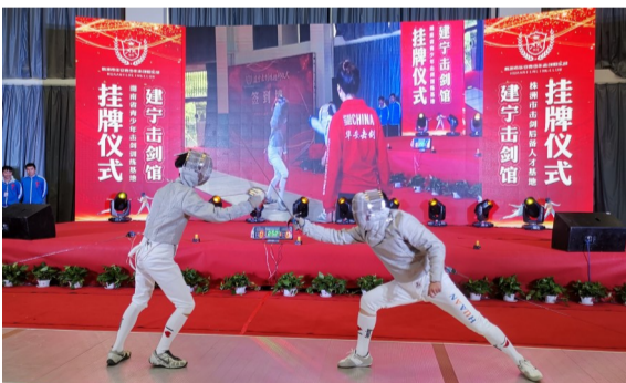
▲挂牌仪式上,两名教练现场实战表演

本报讯(记者 肖蓉)3月28日,经湖南省体育局、株洲市体育局授牌,建宁击剑馆正式成为“湖南省青少年击剑训练基地”、“株洲市击剑后备人才基地”。