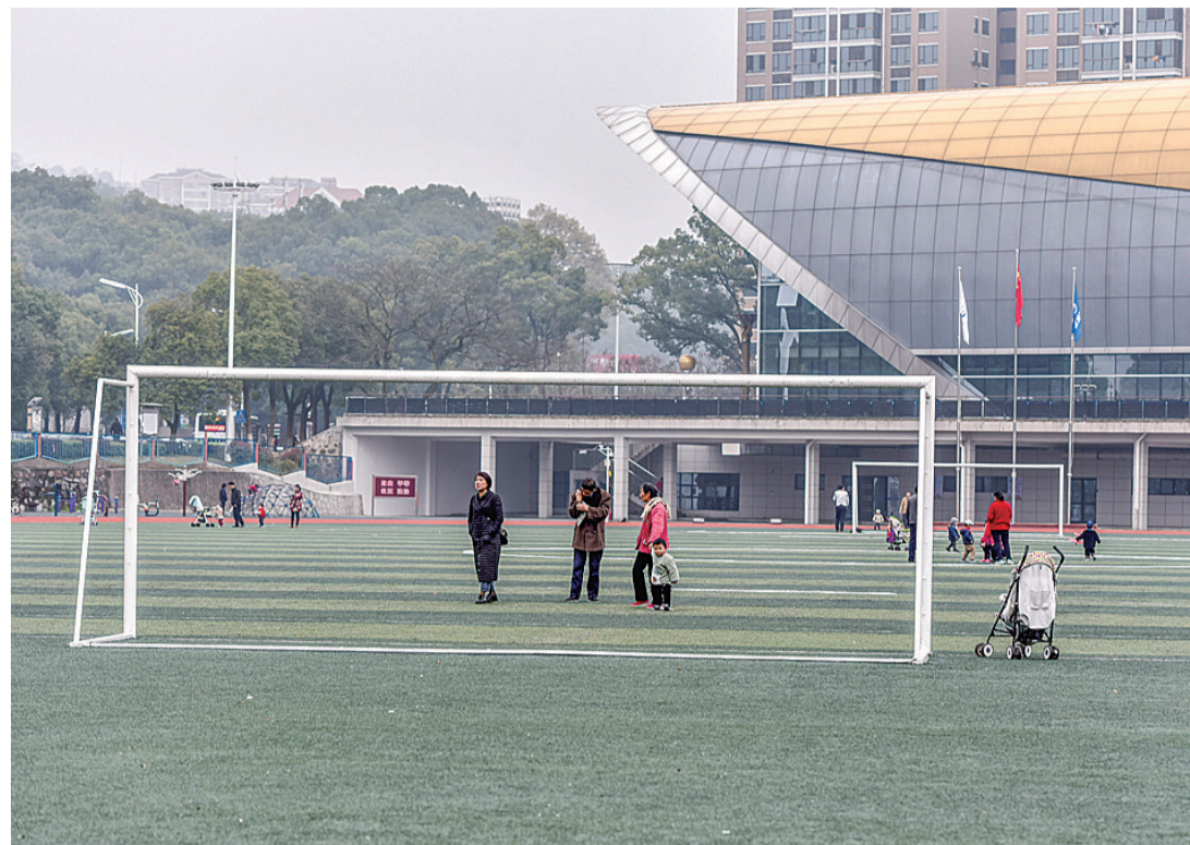
▲3月27日,阴天,市民在株董路附近的体育场里休闲