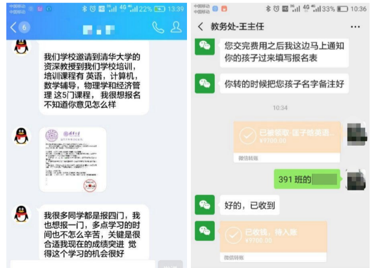
▲“女儿”在QQ里提出要参加清华大学教授的培训班

面对此类诈骗,家长要及时和孩子取得联系,核实事情真伪,谨防上当受骗,一旦被骗要立即报案,方便公安机关第一时间处置,及时止损。目前,反电信网络诈骗平台已联网各大银行,可实现接警止付及快速冻结,系统止付时限为24小时,冻结时限为48小时。