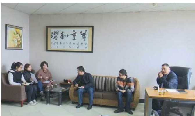
►业主和酒店方协商,要求支付租金