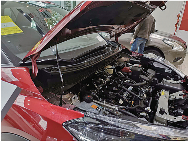
▲当初车子引擎盖就是这样支起的

昨日,彭先生拨打晚报新闻热线28829110反映:2月23日,我在株洲兰天河西日产4S店看车,我父亲打开车子引擎盖看车过程中,不慎弄弯了支杆,导致引擎盖变形和油漆破损,商家要求我们赔偿11000多元,实际上修理费并没有这么多。