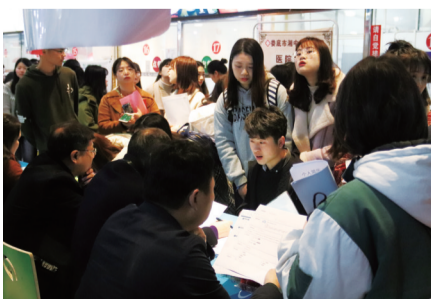
▲毕业生与用人单位面对面交流

据了解,该校组织的这次毕业生供需见面会通过在“就业创业云平台”上发布招聘单位的基本情况,方便学生提前了解岗位需求情况。学生还可以通过该平台在网上直接投递简历,实现线上招聘。在招聘会现场还设置了不少二维码广告牌。负责人告诉记者,学生可以通过扫描二维码进一步解用人单位。将“就业创业云平台”和现场二维码结合,进一步提升了学校的就业服务水平,打造了招聘模式的升级版,为