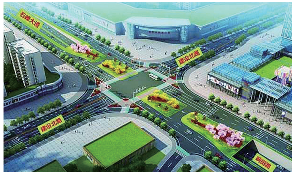
▲响石广场改造工程效果图