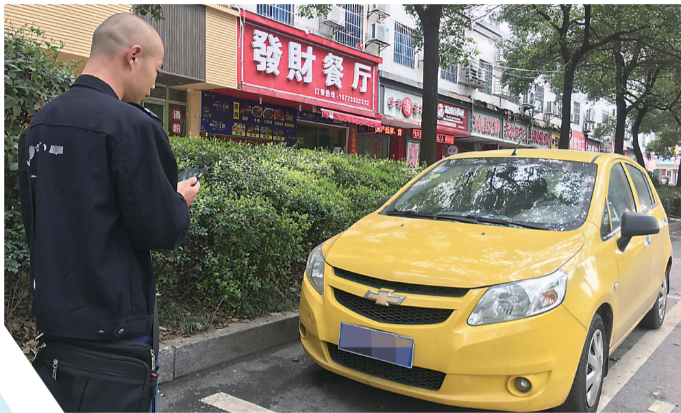
▲道路收费巡管员在对一辆小车录入信息

2018年11月,我市正式启动实施道路停车泊位限时收费,让原本长期被占用的停车位,一下子就“活”了起来。而为了让市民尽快适应这一新变化,株洲市城市公用事业经营有限公司停车事业部的上百名巡管员用真心、热心、耐心、细心、贴心做好停车管理和宣传服务工作,践行“五心”要求,赢得车主的“贴心朋友”称号。