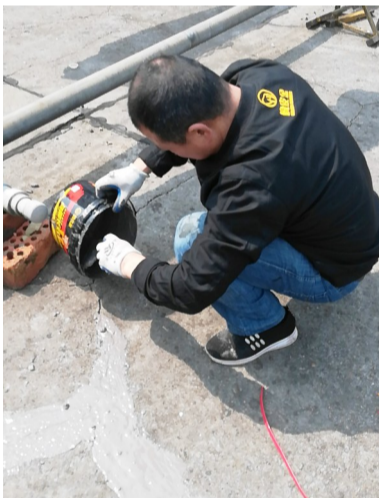
▲“大匠风”工作人员在免费做屋顶防水

5户低收入家庭做好了防水工作,第六户仍在施工中。公司负责人称,在确定好免费的10户并为其做好防水以后,公司会尽快确定10户优惠对象,即免材料费,只收人工费的(按拨打电话先后顺序)10户进行维修,“前期电话对接及上门查看的工作做好以后,后期维修的进度将会加快,我们理解求助家庭的着急心态,但也别太着急。”