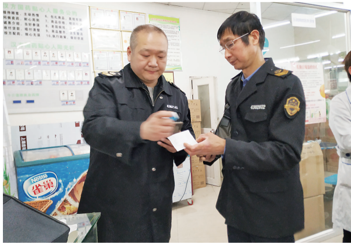
▲执法人员在汉方国药贴心人店检查

本报讯(记者 姚时美)近日,记者接到爆料称,有市民在药店不用处方就能买到一种叫氯氮平片的处方药。记者随后对城区