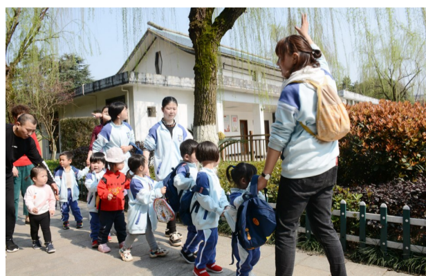
昨天,春光明媚,荷塘区三之三幼儿园的小朋友在老师的带领下,到烈士纪念馆游玩。