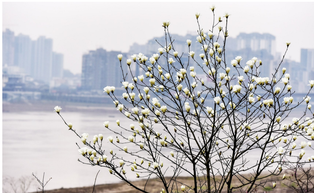
▲近日,河西风光带株洲大桥,玉兰花开

● 每日金句 人一辈子都在高潮和低潮中浮沉,唯有庸碌的人,生活才如死水一般。——傅雷