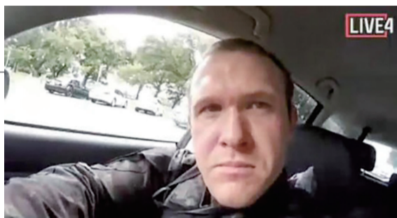
▲枪手塔兰特在网上发布的图片

的伴侣所有。澳大利亚警方说:“行动主要目的是正式获取可能协助新南威尔士州警方后续调查的材料。”新西兰一场大型枪展会原定本月25日在北岛城市奥克兰周边举行。主办方18日在社交媒体留言,说出于对克赖斯特彻奇市枪击事件受害者的尊重,取消展会。这一展会举办已有近五年。(据新华社)