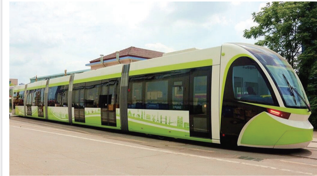
▲五模块储能式现代有轨电车