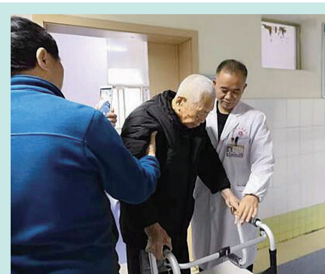
▲术后5天,言爷爷借助助行器下床行走