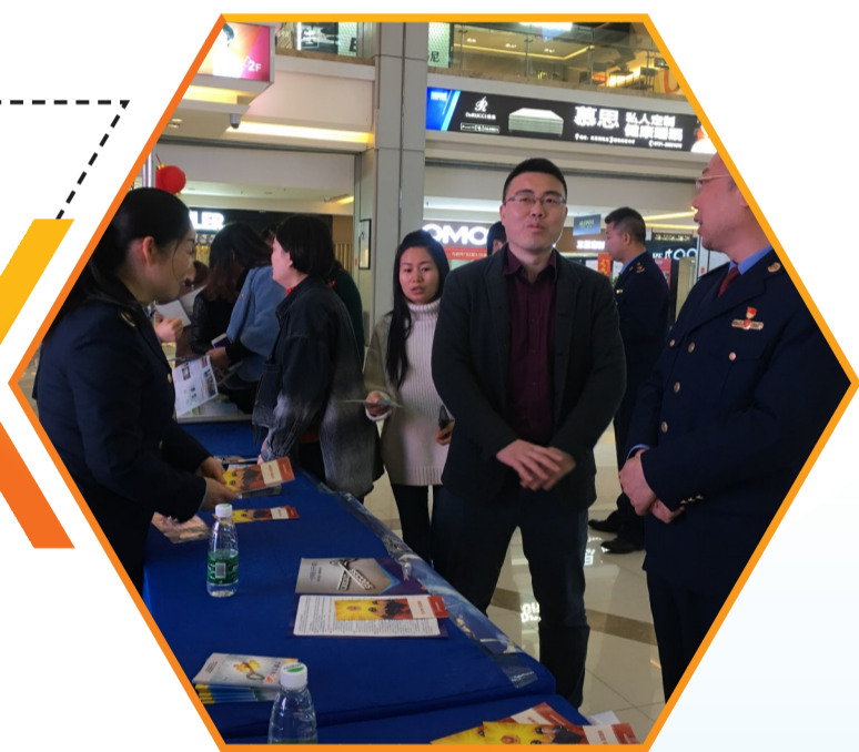
天元工商分局“3·15”活动现场

昨日是“3·15”国际消费者权益保护日,天元工商分局开展了系列活动,在商家和消费者之间架起沟通信任、放心消费的桥梁。