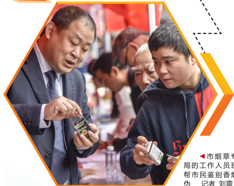
市烟草专卖局的工作人员现场帮市民鉴别香烟真伪

“你们看,假烟一般不可能每个地方都仿得完美。”在昨日活动现场,市烟草专卖局工作人员向前来咨询的市民讲解假烟存在的破绽。