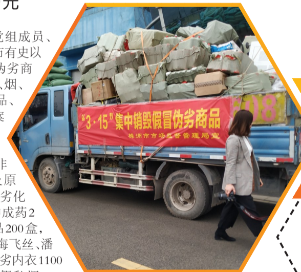
即将被焚烧销毁的假冒伪劣商品