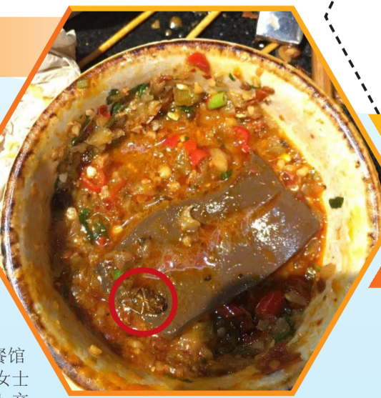
黎女士在老山城火锅店用餐时发现蟑螂