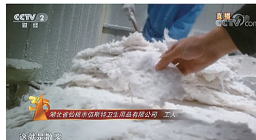
▲卫生纸生产原料 视频截图

节目中曝光了不卫生的卫生用品。佰斯特公司利用散浆生产劣质纸尿裤,部分沾染大片污渍,甚至已经发霉。