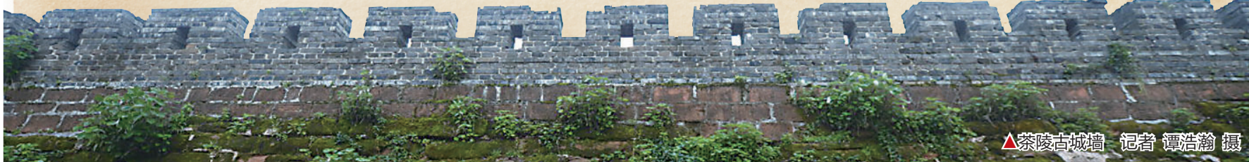
▲茶陵古城墙