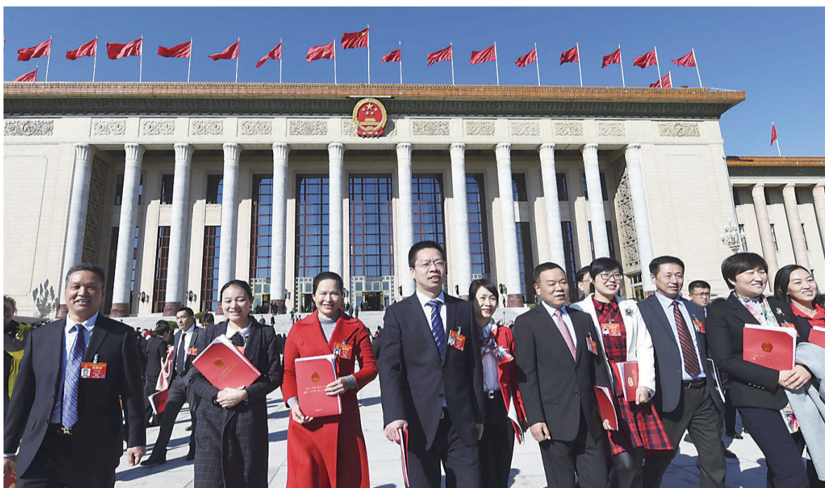
▲闭幕会后,代表们走出人民大会堂