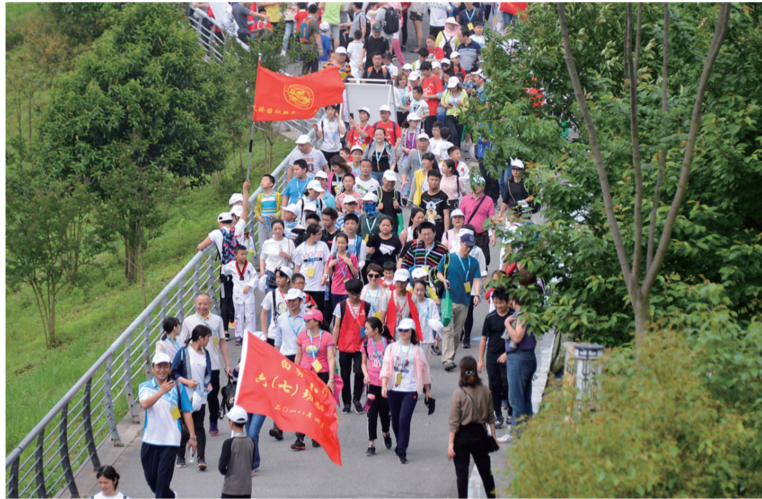
▲往届毅行现场(资料图) 记者 刘震 摄

本报讯(记者 肖蓉)这是一次行走,带着满满的爱心;这是一次挑战,见证坚持的力量;这是一次成长,懂得付出也是一种快乐。你的参与,能改变一个孩子的命运;你的参与,能强健你体魄,丰满你内心。今日起,由美的置业冠名的“2019第十二届徒步湘江毅行”正式启动报名,活动将于4月27-28日进行,共招募7000名爱心勇士共同为爱出发。