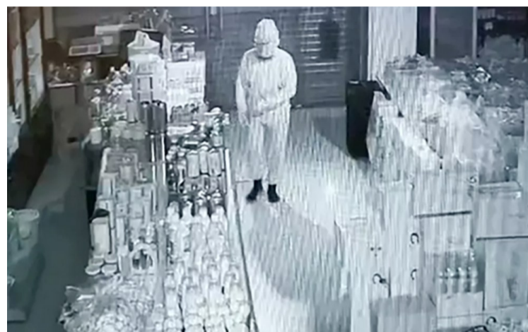
▲戴着帽子、口罩的嫌疑人(视频截图)

本报讯(记者 李卉 通讯员 王学文)凌晨巡逻发现超市内传来诡异打斗声,这是怎么回事?3月10日凌晨1点左右,攸县公安局石羊塘派出所民警开着警车在辖区周边各村组巡逻,发现异常后立即进入店内。