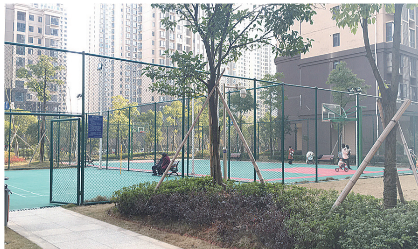
▲山水洲城的篮球场建有围栏,入口处挂有篮球场管理办法