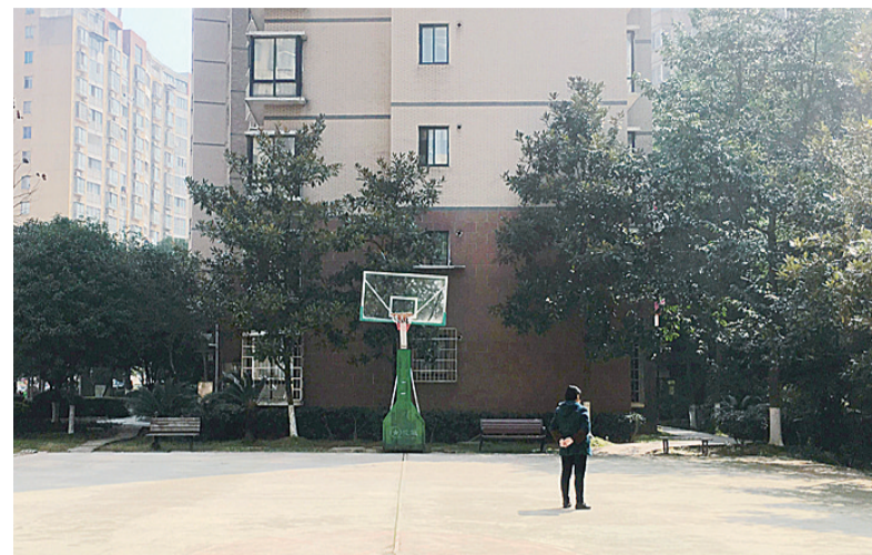
▲湘银小区的篮球场与住宅楼很近,居民与之和谐相处