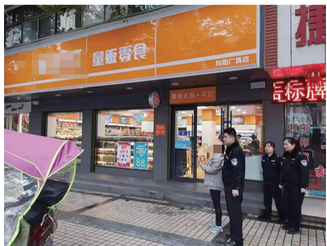
▲犯罪嫌疑人杨某指认现场