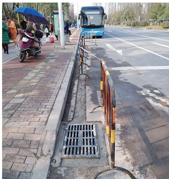
▲市中心医院外新增一处泄水井

本报讯(记者 伍靖雯 通讯员 刘阳)市中心医院外路面沉降,致使行人不便走斑马线通行(详见本报3月4日A09版)。这一问题经晚报报道后,被迅速解决。