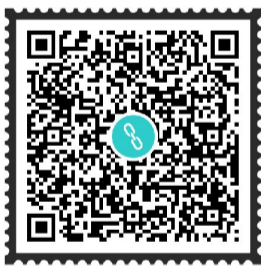
▲扫二维码,登录智慧株洲APP,来看株洲“火娃”的视频

而此时,旁边一起玩耍的小朋友大多还穿着棉裤、棉衣,即使活动量大有些出汗,家长也没给他们脱太多衣服。