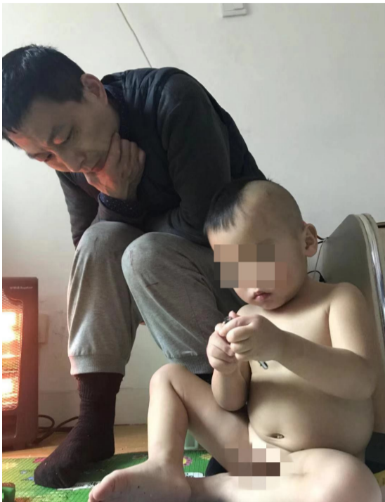
▲球球裸着身子玩耍,一旁的外公冷得要烤电暖炉