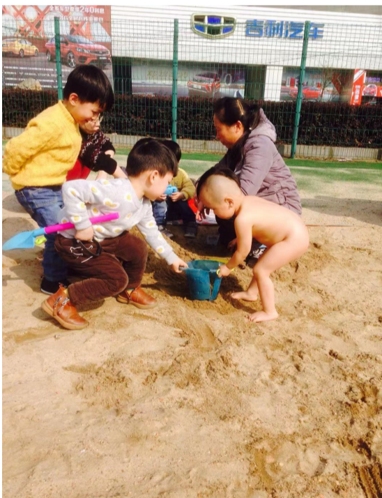
▲3月3日,球球光着身子在户外玩耍