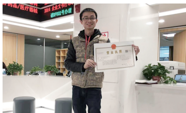
▲第一个领取新版营业执照的群众

“没想到市民中心的办事效率那么高,昨天提交资料今天就拿到营业执照,而且这改版后的营业执照变得更高大上了。”3月1日上午一位小伙子开心地说。他是我市第一个在市民中心拿到新版营业执照的群众。