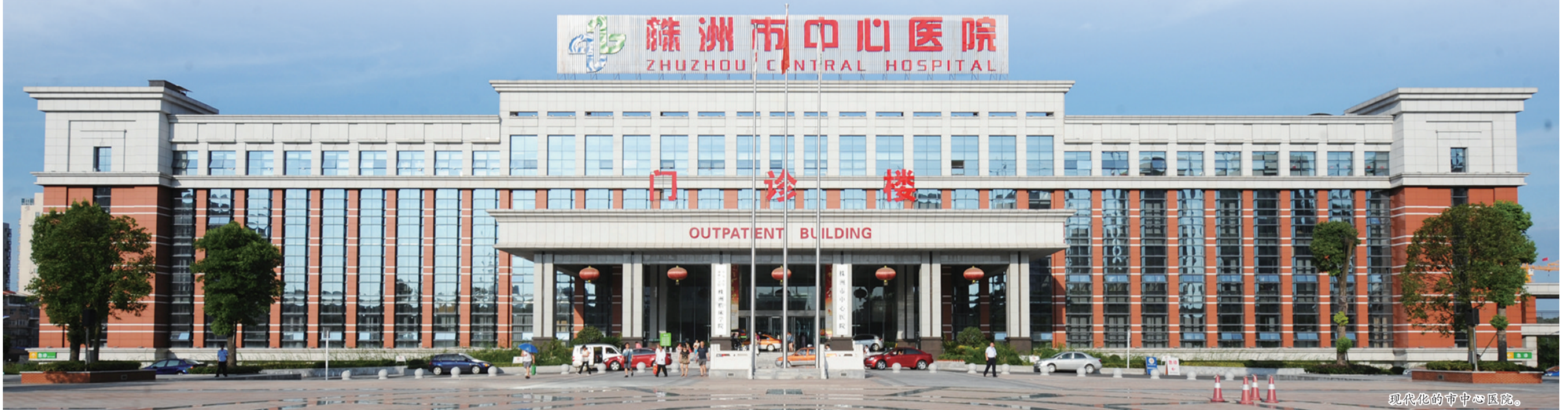
现代化的市中心医院。