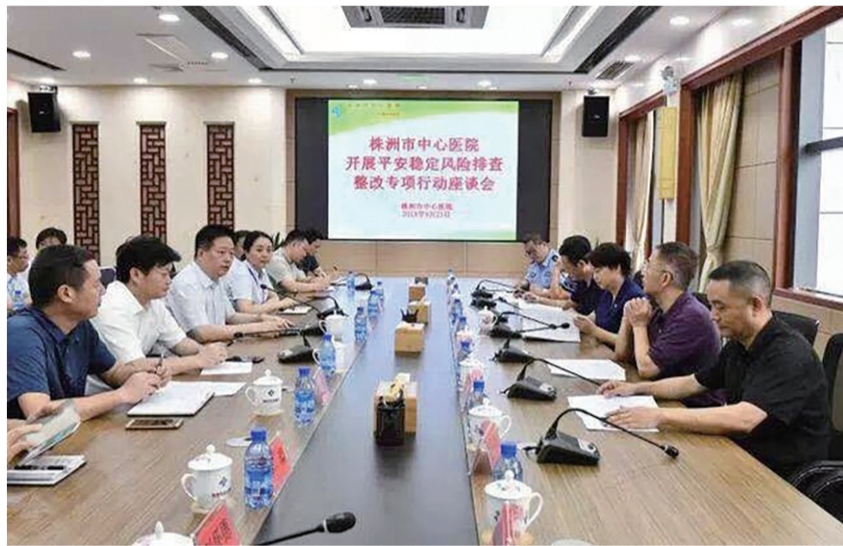
▲ 市中心医院开展平安稳定风险排查整改专项行动座谈会。

近年来,市中心医院以院报、自媒体平台为载体,加大平安宣传正面宣传力度,挖掘了一批典型人物,发送了大量安全公益信息。此外,该院加强与媒体合作,在株洲日报、株洲晚报、株洲政府网等媒体上加大平安建设宣传。