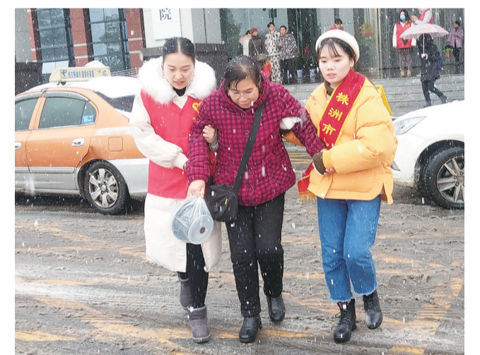
▲ 市中心医院志愿者在冰天雪地里搀扶患者。

此外,该院设立了院长代表岗,推行“一站式”服务,协助病人、陪人第一时间解决就医困难。院长现场接听“12345”,第一时间解决百姓来电反映的民生难题。开展“抗击冰雪保平安”的志愿活动,公开承诺办好2019年14件民生实事。