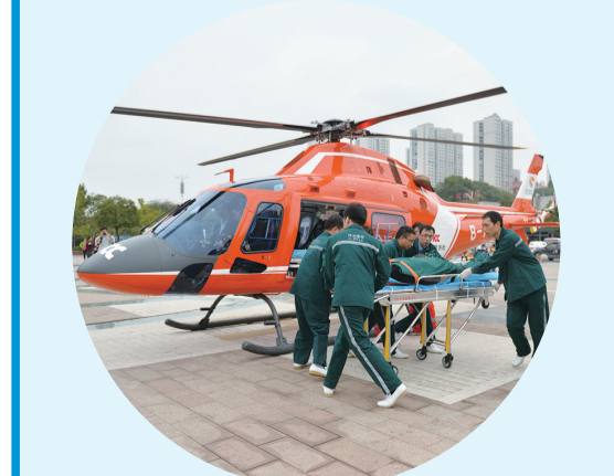
▲ 市中心医院开展航空紧急救援模式。