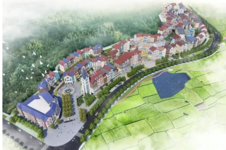
▲青龙湾商业镇效果图

小镇是文化延伸的精神领地,是城市市民最向往的理想生活。在欧美发达国家,小镇历来就是富豪们居家度假的天堂,也是全球各大跨国公司总部所在地。