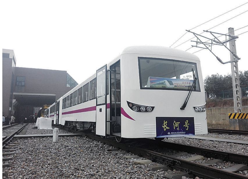
▲前天下午,高职院校与企业联合研制的“长河号”有轨电车在试运行