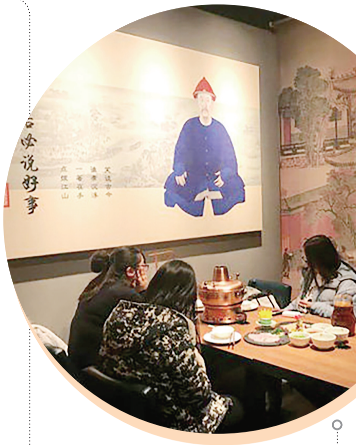
▲故宫火锅店坐落于角楼餐厅