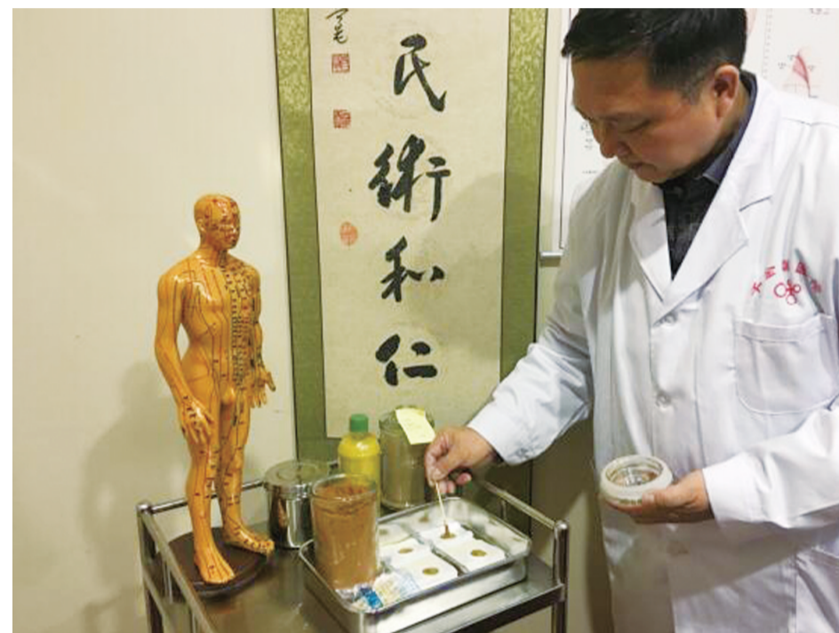
▲千金国医馆医务人员正在配药

胆结石是胆道系统的常见病,其主要症状有发热与寒颤、黄疸、腹痛等一系列症状,严重危害患者健康生活。调查显示,每年约20%的“无症状”胆结石患者出现胆绞痛。如果中老年患者兼有冠心病,胆绞痛发作时就会引出冠心病的症状,如胸闷、胸痛、气短等不适。这种绞痛严重时可出现休克,甚至生命危险。