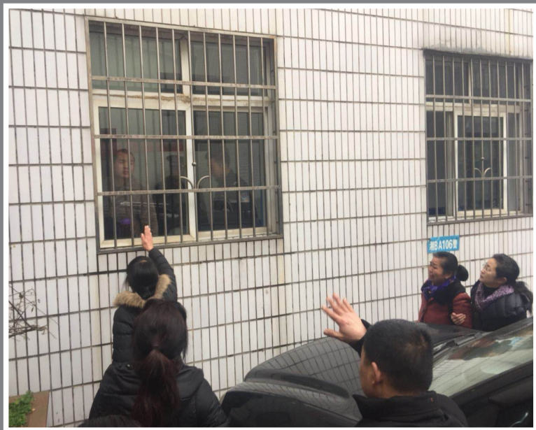
▲芦淞区法院判决后,家属哭着嘱咐被告人好好改造

本报讯(记者 贺天鸿 通讯员 罗达 陈善文 罗丽芳)昨日,芦淞区法院、石峰区法院各一审判决了两起恶势力案件,最终共14人获刑,其中最高获刑12年。