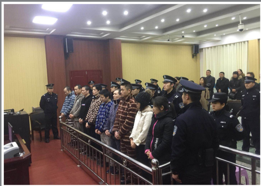
▲芦淞区法院判决现场