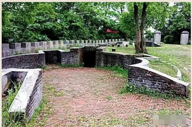
▲凤凰山上的炮台

三三一的防空洞特别多,解放村、凤凰村、迎新村、友好村、言家村、茅屋街……在我脑海里,几乎能回忆起的每个家属村,它们附近都有防空洞。