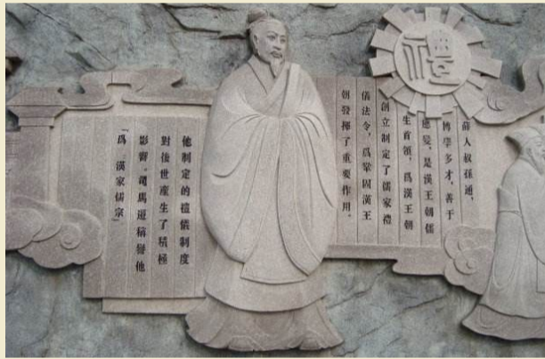
▲博士叔孙通为刘邦制定了一套行之有效的礼仪制度,规范大臣们的行为,使得刘邦感叹道:“吾乃今日知为皇帝之贵也!”