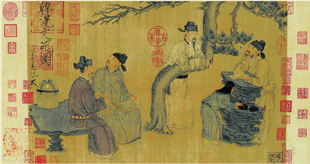
▲《文苑图》(旧题韩滉,今人考作者为五代周文矩)

汉文帝时,为了广开学路,设置了研究百家学问的诸子书博士和研究儒家经典的专经博士,著名的大臣晁错、贾谊、董仲舒都是博士出身。到了汉武帝时期,汉武帝采用董仲舒“罢黜百家,独尊儒术”的主张,设置了五经博士。五经是指《诗》《书》《礼》《易》《春秋》,五经博士的选拔主要通过征召和举荐,选拔的标准很高,要求为“学通经行,博学多艺,晓古文《尔雅》,能属文章者”(《汉书六种》),不仅要通经明义,还要品行高洁。东汉时期,还有专人负责博士候选人进行考核,考核的结果还要经过皇帝的裁决。五经博士相对于原来的博士官,增加了在太学教授弟子的职责。博士弟子由最初的50人,到东汉时期增加到近三万人。从这一点来看,那时的博士官倒有点像现在的博士生导师了。