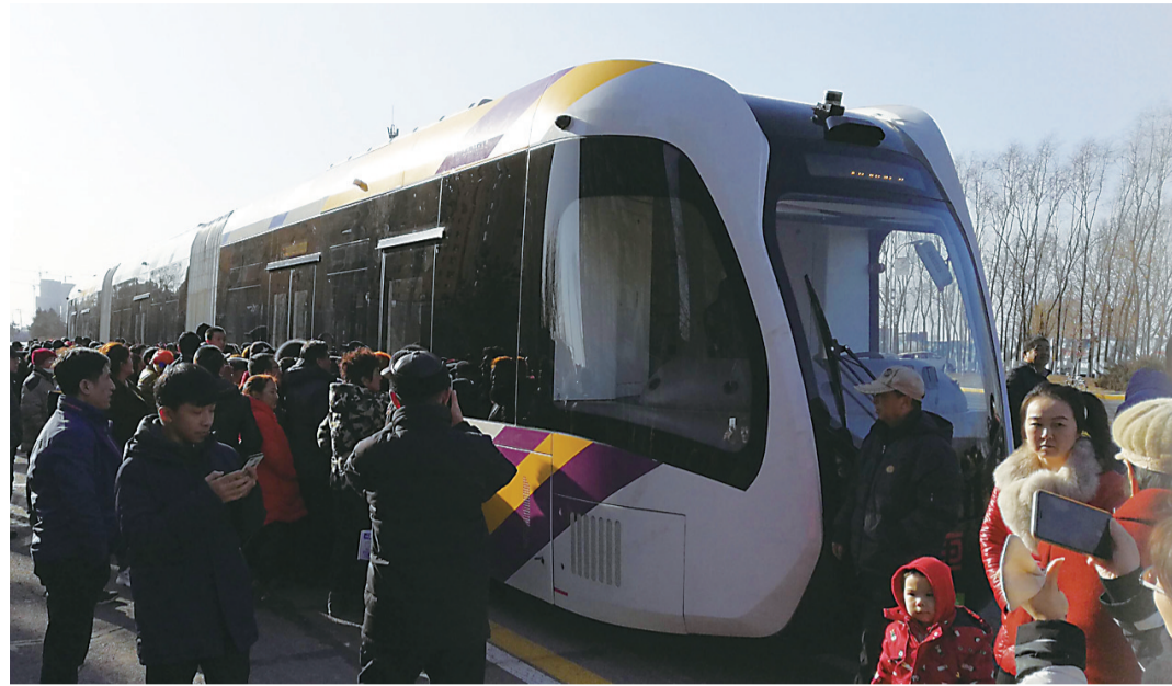
▲哈尔滨市市民围观智轨电车

本报讯(记者 伍靖雯 通讯员 姜杨敏)昨日上午开始,株洲造智轨电车在哈尔滨市松北区开始为期10天的载客试运行。