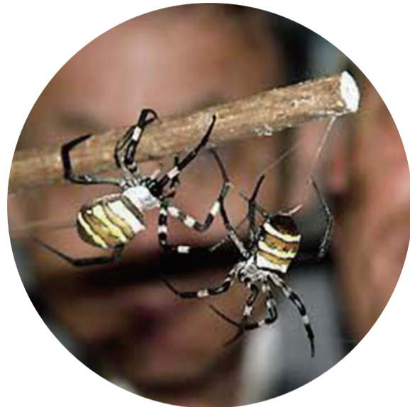
▲两只雌性蜘蛛在一根细棍上决斗(资料图)