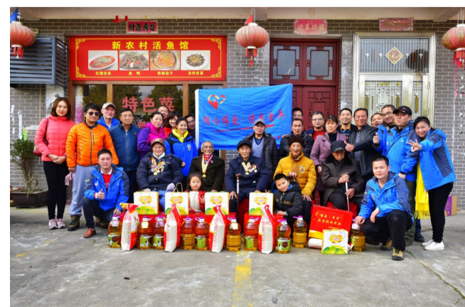
昨日,民革株洲市委党员志愿者和湖南老兵之家志愿者为攸县抗战老兵送去年货。 据介绍,过年前后,民革株洲市委党员志愿者慰问了全市健在的40名抗战老兵。图为志愿者和炎陵老兵合影。