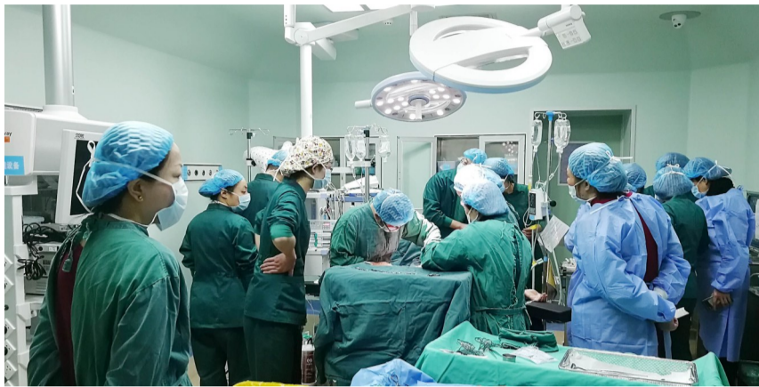
▲抢救现场图 通讯员供图

随后,孕妇逐渐出现咳嗽、胸闷、气促、血压下降等症状,而此时宫口才开大5cm,估计短时间内无法阴道分娩。抢救小组当机立断,必须紧急剖宫产终止妊娠,抢救母婴生命。谈话、签字、术前准备、抽血化验、备血、麻醉、立即气管插管、液体复苏、维持血流动力学稳定、解除肺动脉高压、抗过敏、处理凝血功能障碍,并迅速全面监测。产科大主任彭杨带领抢救队员们迅速取出胎儿,从开始剖宫产到胎儿娩