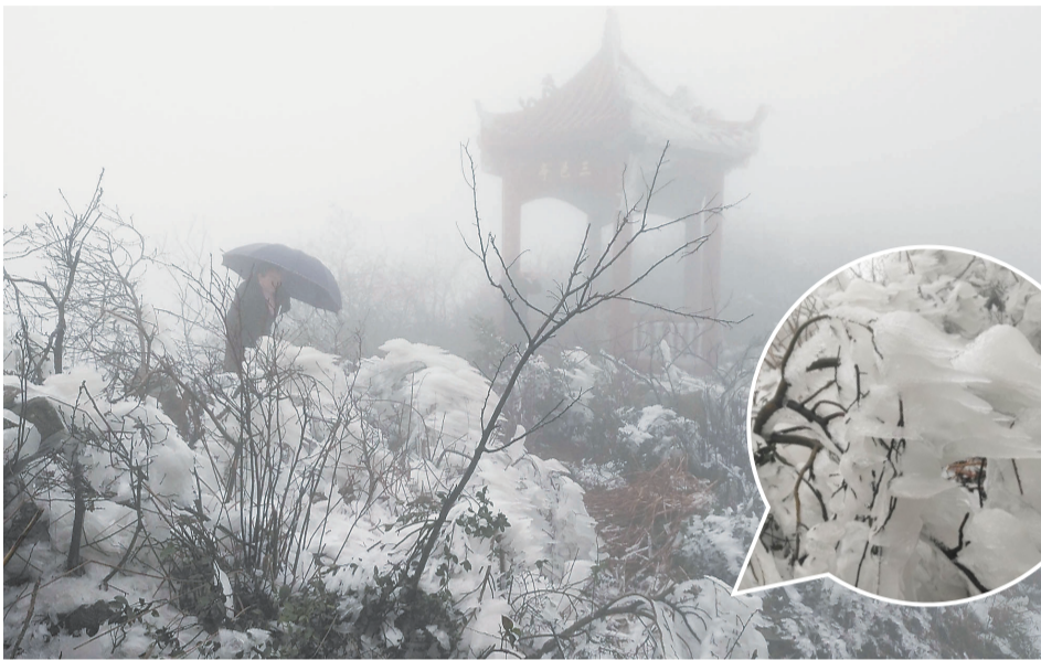
▲蓬源仙雾凇景观

本报讯(记者 肖捷 通讯员 刘志刚)近日受冷空气影响,攸县网岭镇灯笼桥村蓬源仙出现雾凇景观,引得不少游人前来观看。现场,洁白晶莹的雾凇缀满了枝头,银装素裹分外妖娆。山顶的道观仿佛披上了洁白的毛毯,毛茸茸的雾凇像松软的棉花,显得晶莹剔透。沿着山顶而下,一根根树枝形成形态各异的雾凇,千姿百态随风摇曳。