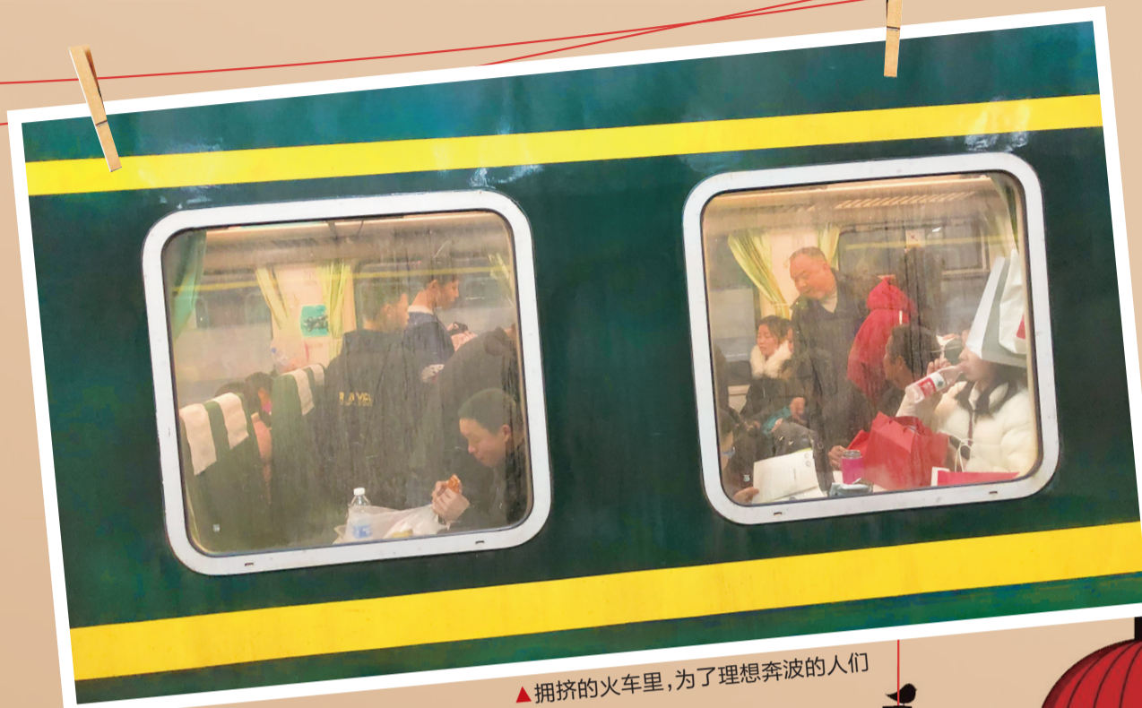
拥挤的火车里,为了理想奔波的人们