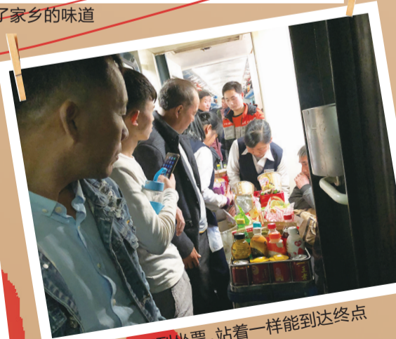
买不到坐票,站着一样能到达终点