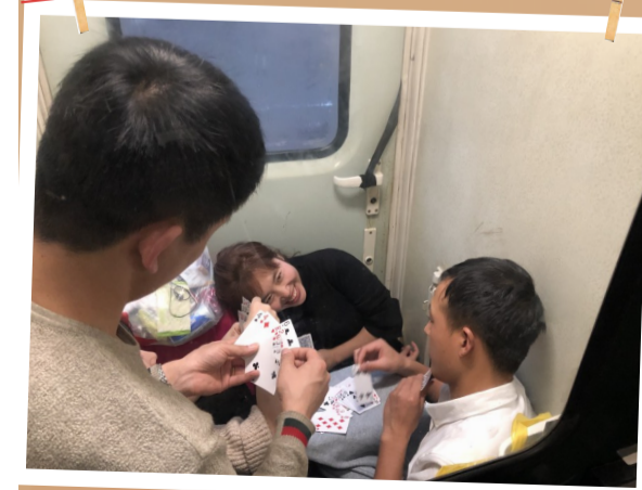
漫长的旅途,短暂的娱乐