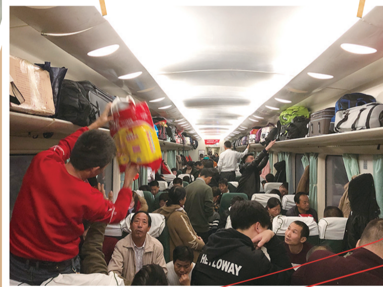
返程的行囊里,装满了家乡的味道