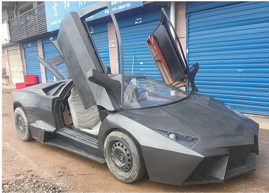
▲李金国花费4年打造的“兰博基尼”

本报讯(记者 刘玺)30岁的李金国是中车株机的一名电工,他从小就希望拥有一辆酷炫跑车。2015年,他将这一想法付诸实际,花费4年业余时间,打造出一部外形仿真度达到80%的“兰博基尼”跑车。