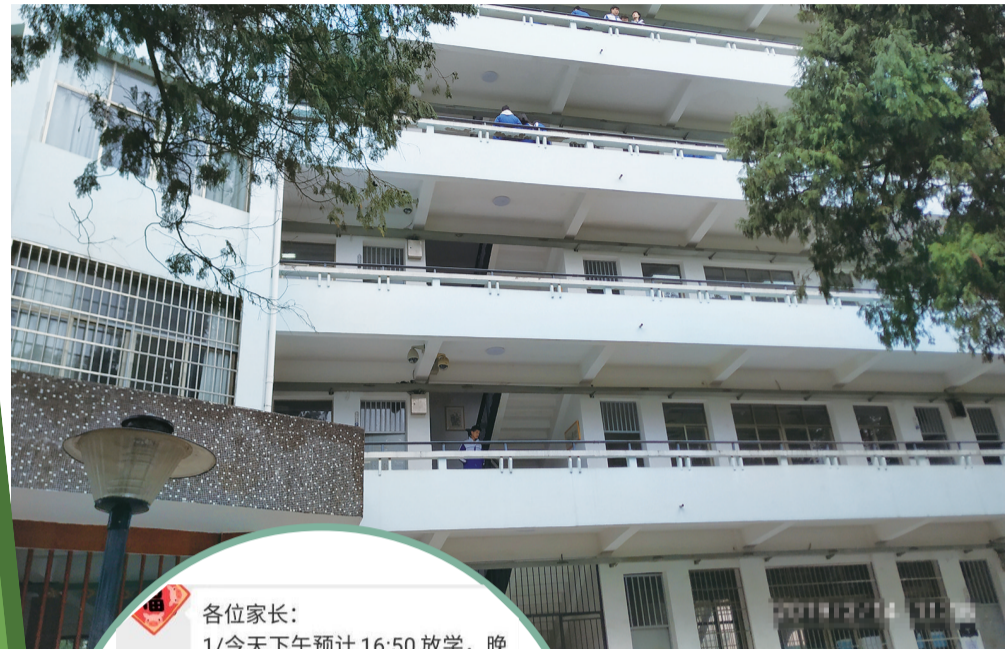
▲昨日,市四中学生正在教学楼内,楼下大门上锁

昨日,记者根据举报者及市四中等学校反馈的情况得知,市一中接到通知后已经停止补课,市四中于2月13日停止高一年级提前入学,高二年级在昨日记者介入后已经停止补课,市十三中停止补课,醴陵市一中停止补课;市二中、九方中学、醴陵市二中的高二年级还在继续补课;市八中的情况,记者没有得到反馈。