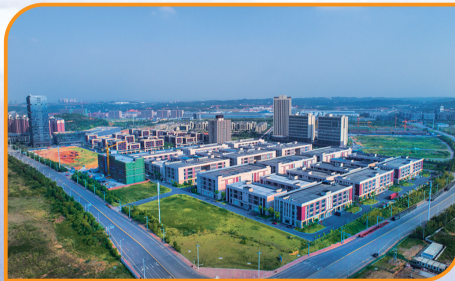
▲蓬勃发展的株洲·中国动力谷

壮大粮油产业,强化龙头品牌。“粮油强品牌三年行动”成效显著,全市新增国家高新技术企业1家、湖南省农业产业化龙头企业1家、市级农业产业化龙头企业3家、国家“有机产品”认证2个、国家“绿色食品”认证1个、省名牌产品1个、省著名商标1件、国家发明专利3件,2个粮油公用品牌、1家粮油企业品牌、6个粮油产品获评2018年“株洲市十大农业区域公用品牌、十大农业企业品牌、十大农产品”。去年,全市粮油加工及物流总产值突破110亿元。