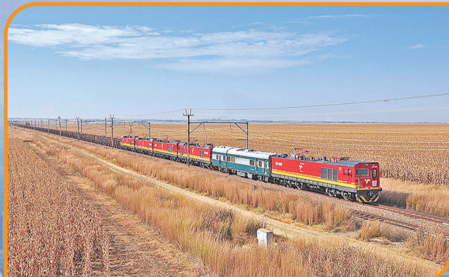
▲轨道交通装备从株洲驶向世界