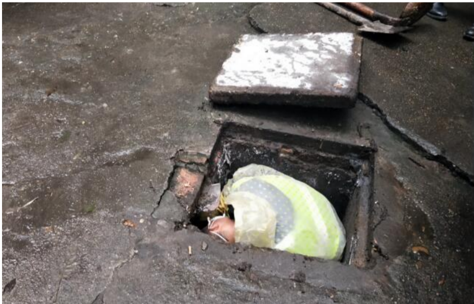
▲芦淞城管市政队员到王塔冲一村27栋疏通下水道

“快过年了,我们希望小区里干干净净,不用担心下水道堵塞,你们能帮忙吗?”1月29日,家住王塔冲一村27栋的网友“琦”写下这一城管心愿。