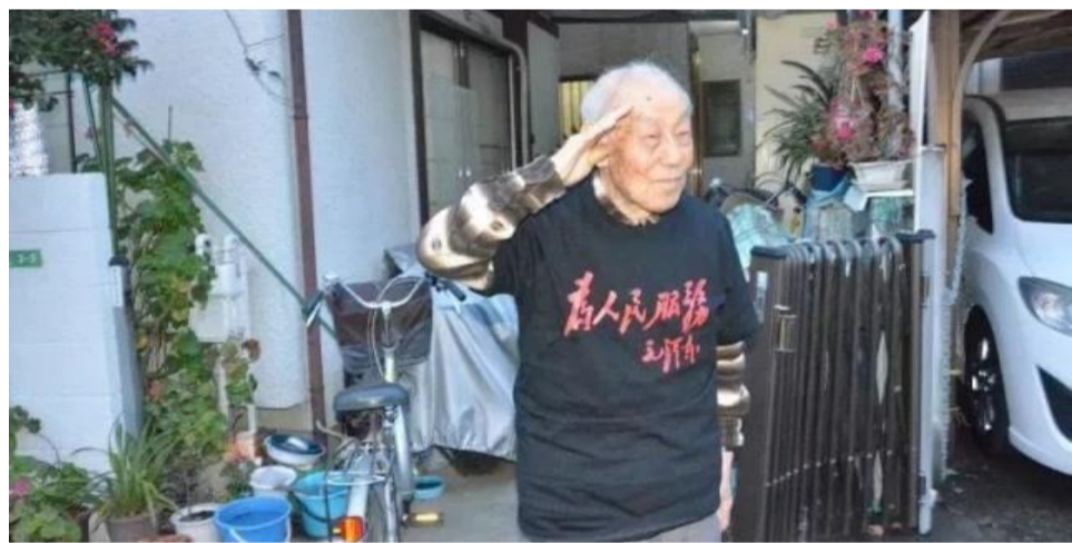
▲小林宽澄穿着印有“为人民服务”字样的衣服在自家门前敬礼

1月16日晚,一位老人在日本去世,享年99岁。这位老人是日本人,曾参加日本侵华战争,被八路军俘虏后,成为了抗战同盟的一名八路军战士。他作战时出生入死,在离日军据点仅三四百米远的地方对日军官兵进行反战宣传。老人回国后,成为对华友好人士。1955年他复员回到日本,一直受到监视,直到85岁后才解除。但他依然四处演讲、作报告,揭露日本侵华战争的真相。他的名字叫小林宽澄。老人是参加过抗战的日本籍老兵中,最后一个离世的。