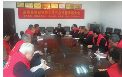
▲茶陵县关爱留守老人项目总结暨表彰大会现场

关爱留守老人社工支持项目是市老龄办积极应对人口老龄化,增进留守老人社会参与,健全农村为老服务体系创新举措,通过政府购买服务的形式,引进专业社工机构,在天元区、芦淞区、淞口区、茶陵县选择了四批次共20个村(社区)进行项目试点。其中,2018年在茶陵县选取了柘田村、腰陂村、星峰村、石联村、祖安村五个村为试点单位,以农村留守老人为服务主体,以基层老年协会规范化建设为突破口,以互助养老为着力点,开展了“情暖夕阳一能力提升计划”、“温暖陪伴一结对帮扶计划”、“心灵家园一互助支持计划”、“缤纷乐龄一长者康娱计划”、“医路相伴一医护服务计划”五大主题服务。通过探索打造“老年协会+社工/义工”的服务模式,培育发展了105名互助养老志愿者持续参与项目服务,建立关爱留守老人档案625份,开展综合能力培训、探访慰问、文体娱乐活动等系列活动54场次,累计提供上门医疗、助购、助洁、精神关怀、临终关怀等为老服务达2885余人次。(唐珂 欧阳飞鹏)