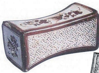
▲南宋吉州窑瓷形彩绘瓷枕