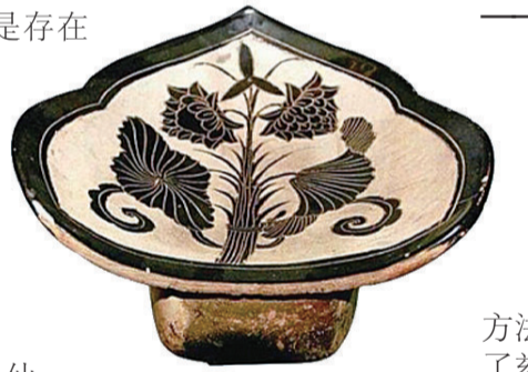
▲北宋磁州窑白地黑花把莲纹枕

睡瓷枕的习惯是存在个体差异的,有的人喜欢它清凉解暑,有的人抱怨它冻得人脑仁儿疼。