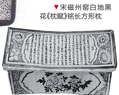
▼宋磁州窑白地黑花《枕赋》铭长方形枕