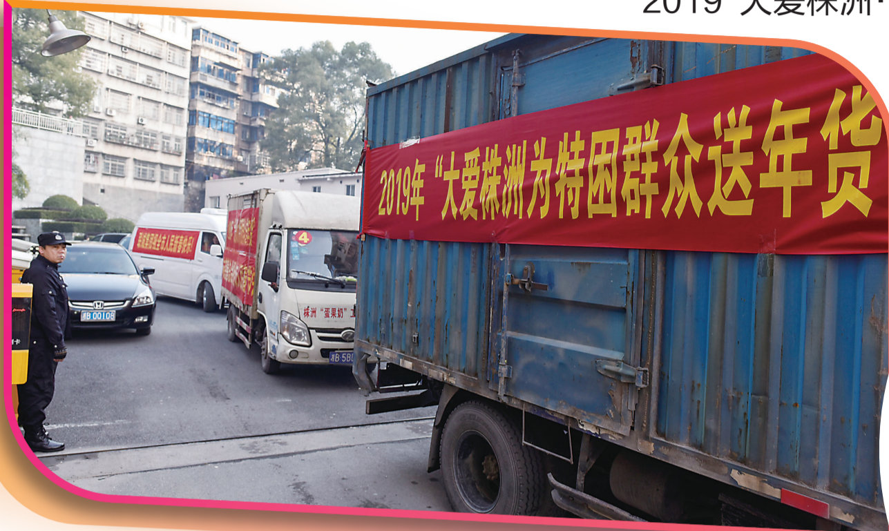
▲满载爱心年货的车辆出发

暖阳驱散了深冬的寒意,也映衬着大家对美好生活的憧憬。昨日上午9时,2019“大爱株洲·为特困群众集中送年货”暨启动仪式在团结大院举行。市委常委、统战部长覃万成宣布爱心车队启程,748份承载着暖暖爱心的年货从这里随车发出,被送往城市各区的特困群众手中。 2019“大爱株洲·为特困群众送年货”爱心公益活动由市委统战部、市慈善总会、市工商联和株洲晚报联合主办,民革市委、民盟市委、民建市委、民进市委、农工党市委、致公党市委、九三学社市委、市知联会、市委台办、市侨联共同承办,华晨地产、神骅地产、信佳百货、联诚集团共同协办。 “衷心感谢参加活动的爱心单位和个人。”启动仪式上,株洲日报社党组书记、社长赵先辉介绍,截至1月21日,本次活动已经筹集了超过70万元的爱心年货款,将给1400余名特困群众送去温暖。此次活动慰问的都是特困低保户、孤寡老人和三无老人,名单由市民政局提供,民政部门、各街道办事处、各社区居委会的工作人员进行严格核对把关。 神骅地产白金汉宫项目营销总监文竹根代表爱心单位和个人发言时称,这是该公司连续第10年给特困群众送爱心。对于困难群体,公司愿意伸出援助之手,让他们感受社会温暖,希望有更多的爱心单位和个人加入到公益事业中。 随后,5辆满载年货的货车奔赴城市各区,本报记者随车前往,和各爱心单位代表一起,将现金红包和年货物资送至748名特困群众手中。 市慈善总会会长、市人大常委会原主任姜玉泉,市领导刘春生、余群明、周恕、金继承、柳怀德、周照惠参加启动仪式。