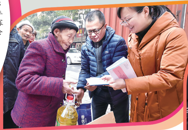
▲媿媿接过年货和红包喜笑颜开