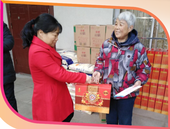
▲三门镇民政干部把年货送到贫困户手中