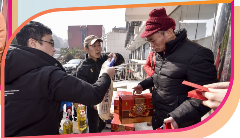
▲特困群众从渤海银行株洲分行工作人员手中接过年货和红包