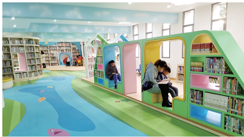
▲提质改造后的少儿图书阅览室正式开放

本报讯(记者 肖蓉 通讯员 严丹)1月23日,位于文化园内的市图书馆全新打造的少儿图书阅览室正式对小朋友开放。该阅览室内藏有儿童读物8-10万册,可以同时容纳200多个小朋友阅读。