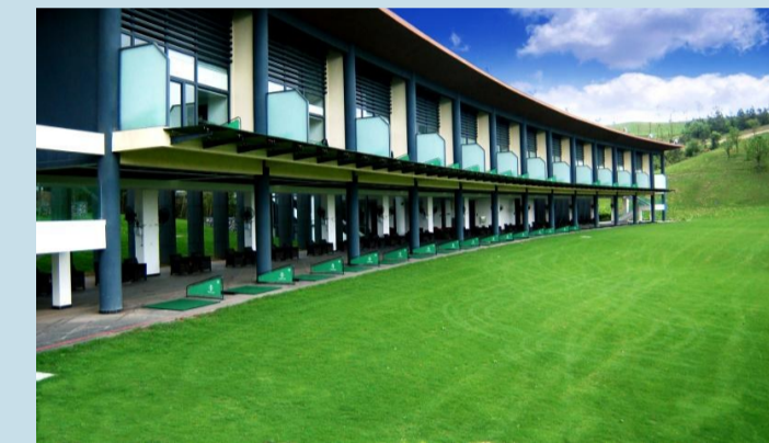
▲高尔夫球场实景图