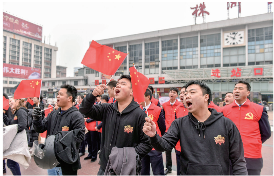
▲40余名青年志愿者表演“快闪”,饱含激情地合唱《大中国》

本报讯(记者 肖蓉 通讯员 许浩 龚雪妃)新春至,万千游子归家时。1月21日,2019年春运的大幕拉开。今年春运,株洲火车站新增了6台“人脸自动识别验证机”,方便旅客检票,湘运汽车也推出了“1分钱乘车”优惠措施。候车室里新换上的温暖坐垫、一杯杯滚烫的姜茶,为来往旅客拂去了冬日的寒冷。