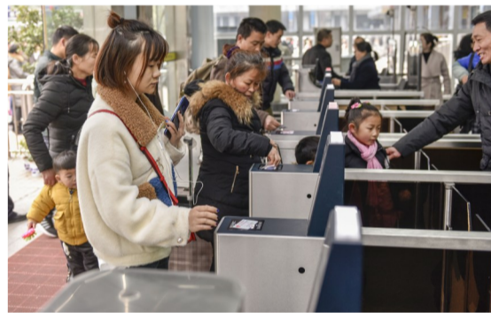
▲株洲火车站新增了6台“人脸自动识别验证机”,方便旅客检票

记者还发现,株洲火车站候车室的座椅上均安装了温暖的坐垫,而身穿红色马甲的“彩虹”志愿者们分布在售票厅、入检口、候车室等处,随时为旅客提供出行咨询、重点旅客帮扶等工作。