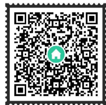
▲扫码可在“智慧株洲”app观看《出行宽松点》MTV

据了解,《出行宽松点》创作团队由来自株洲火车站的10名青年职工组成,该作品是团队继去年的《出行简单点》后创作的第二部春运歌曲。